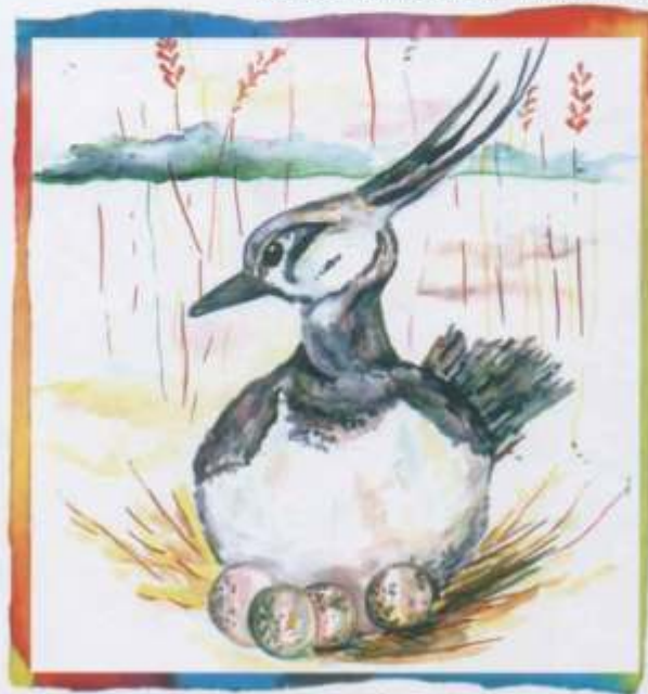
Аляксандра Мышко, 16 гадоў (Жодзіна)