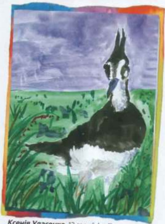
Ксенія Уласенка, 13 гадоў (в. Палонка)