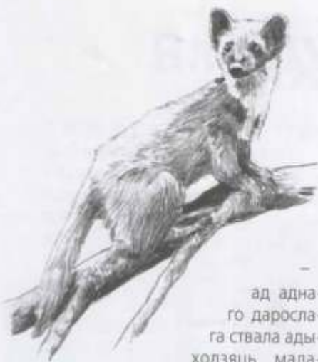
ад адна- го даросла- га ствала ады- ходзяць мала- дыя ствалы-па- сынкі.

А каб на вольху не так моцна ўплывала змена ўзроўню вады вясною, дрэвы часта растуць у поймах рэк, займаючы купіны.