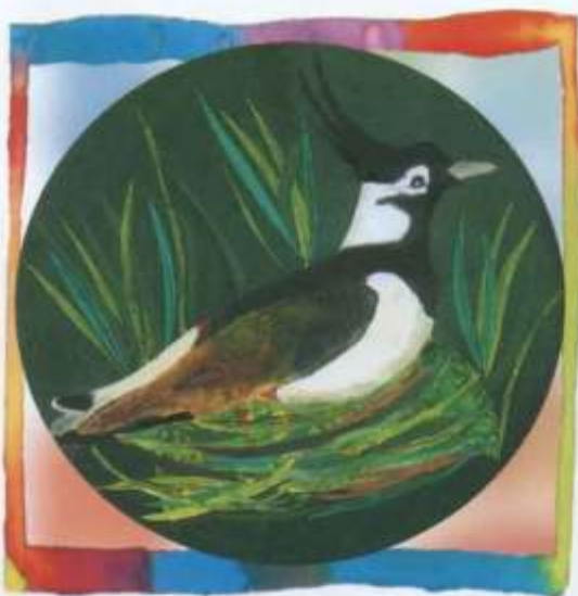
Вераніка Смаль, 12 гадоў (Слуцк)