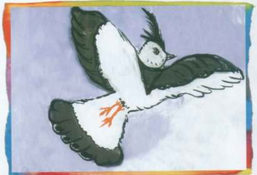
Алеся Леановіч, 6 гадоў (Мінск)