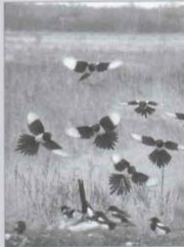
На здымку: САРОКІ. Нараўлянскі р-н, Палескі запаведнік