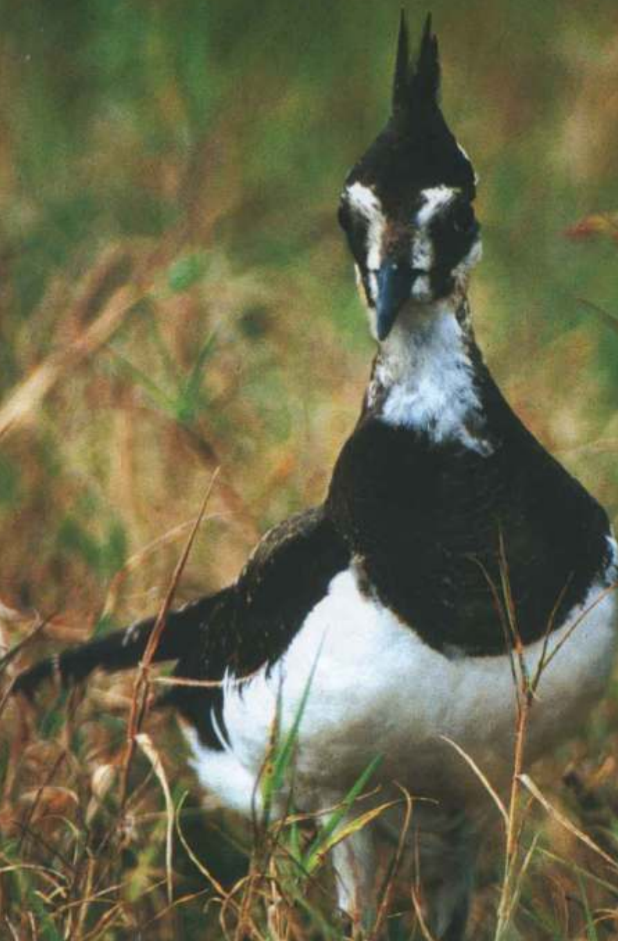
Кнігаўка ( Vanellus vanellus )