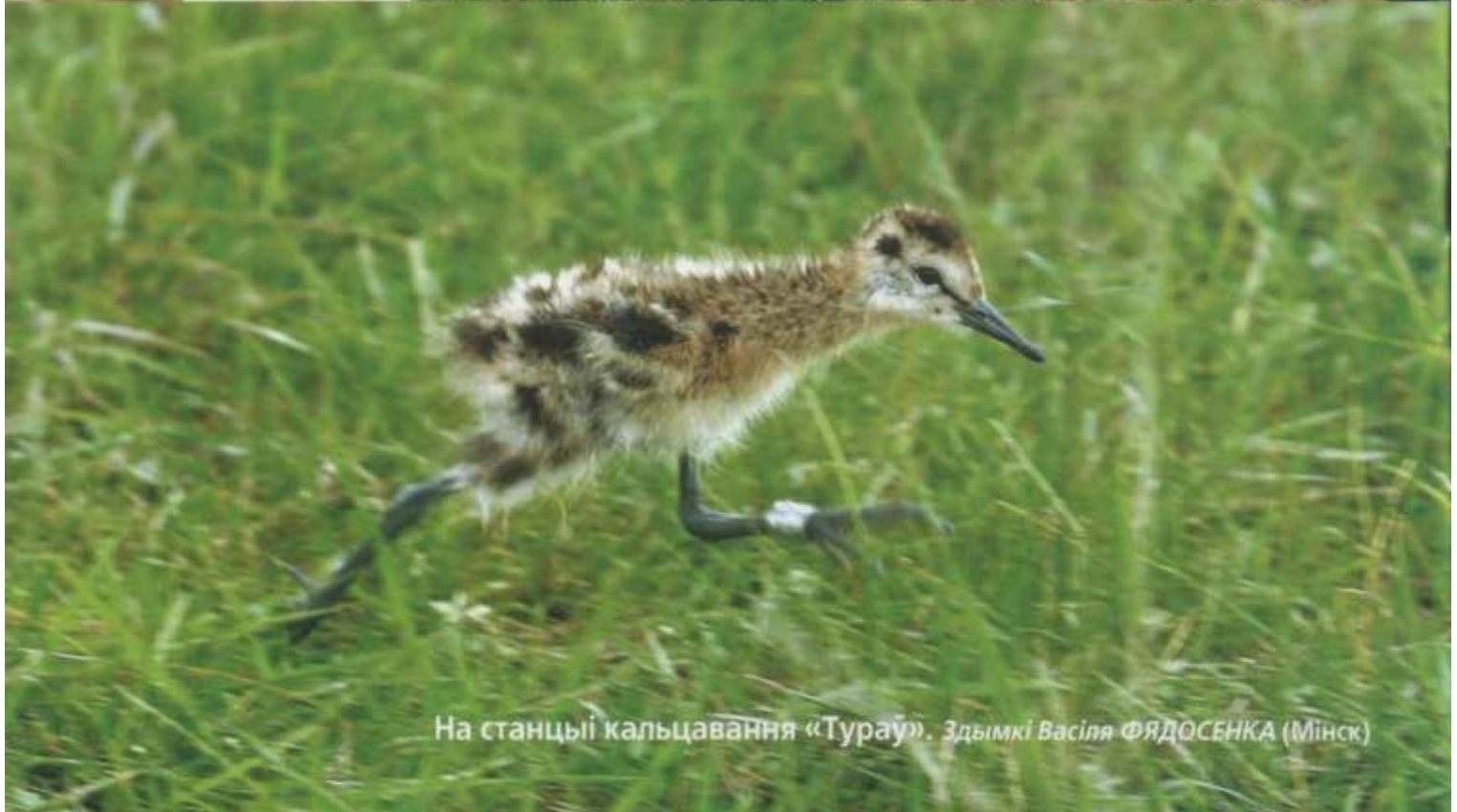
На станції кальцавання «Тураў».