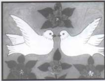
Маляванкі на шкле. Другая палова XX ст.