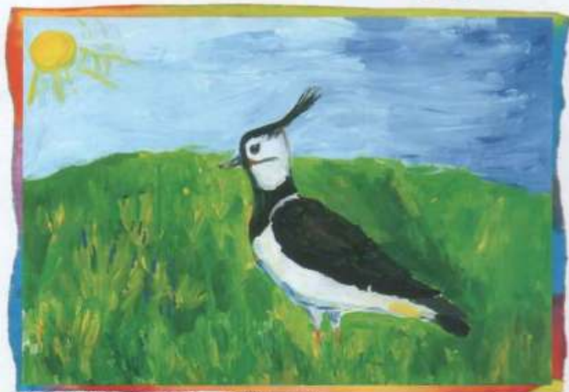
Анастасія Сідарэнка, 12 гадоў (Жодзіна)