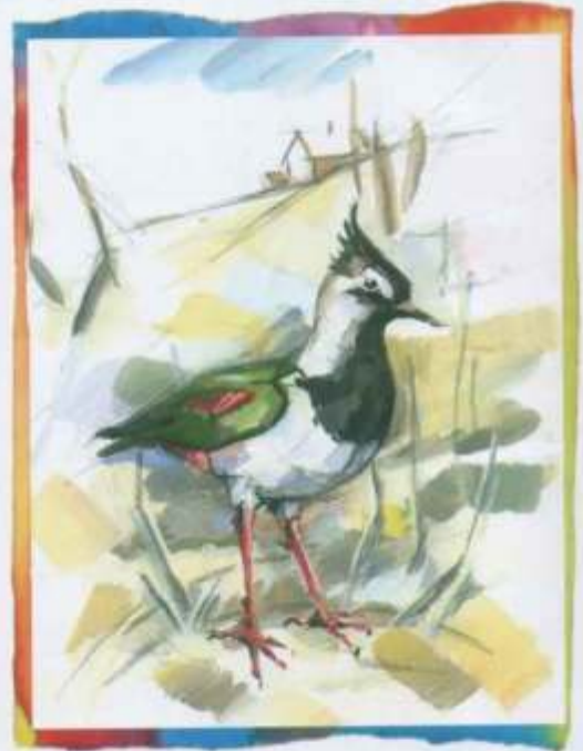
Міхаіл Шэметкоў, 16 гадоў (Жодзіна)