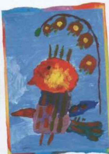
Віка Стонька, 6 гадоў (в.Шашкі, Стаубцоўскі р-н)